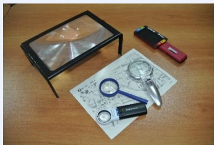
Оптические лупы, портативный видеоувеличитель и др.