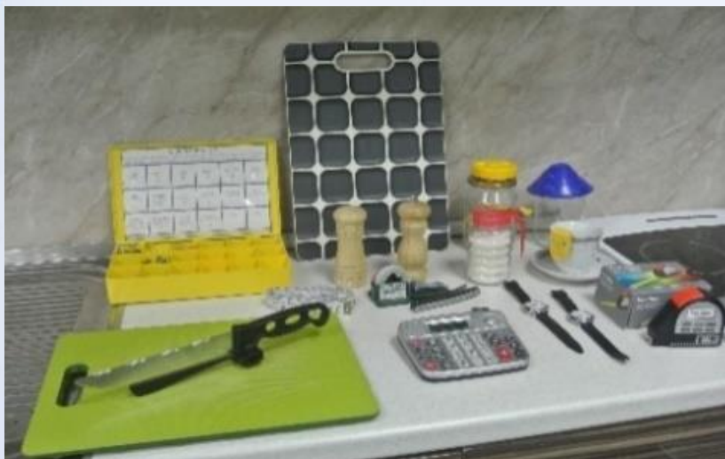
Нож-дозатор, говорящий калькулятор, говорящая рулетка и др.