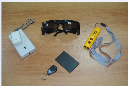
Говорящий маячок, ультразвуковые очки, электронная трость и др.