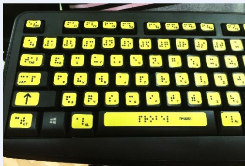
Пример адаптации предметов быта тактильными и брайлевскими метками для незрячих и слабовидящих