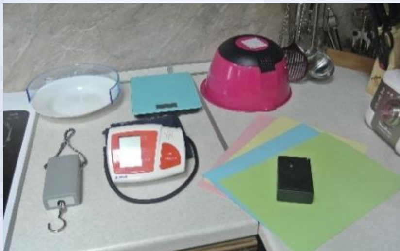
Говорящий бытовой безмен, медицинский тонометр с речевым выходом, определитель цвета и др.