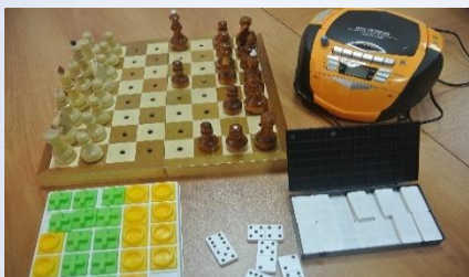
Шахматы, шашки и домино для пользования незрячими

Существует много способов проведения свободного времени: прогулки, слушание телевизора и радио, посещение концертов и спектаклей, музеев, спортивных площадок, игра в досуговые игры.