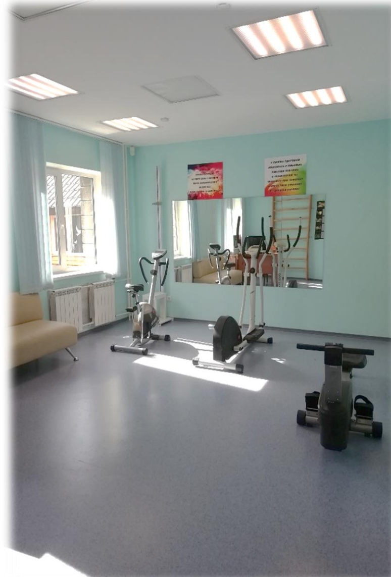
Кабинет лечебной физкультуры