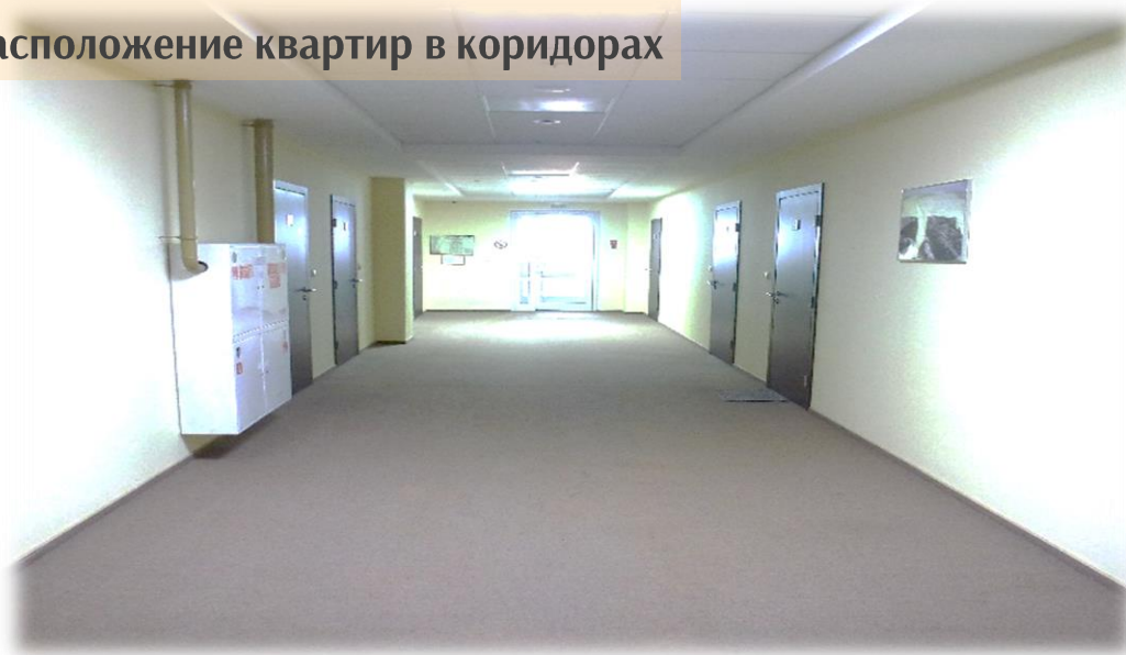
Расположение квартир в коридорах