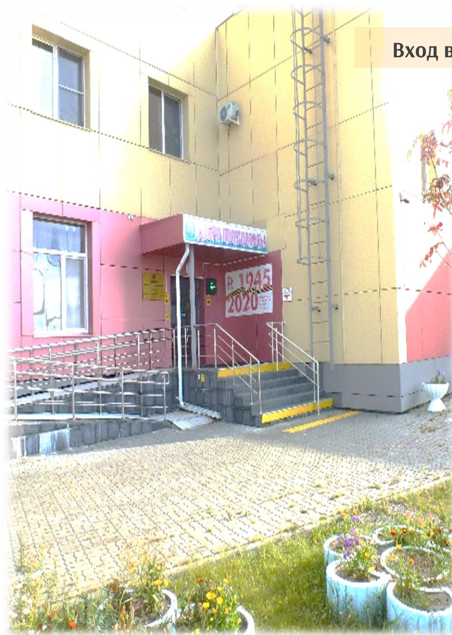
Вход в здание